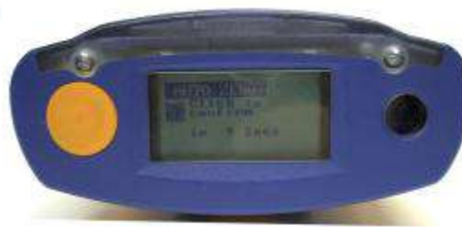
Click para confirmar ZERO