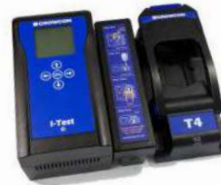
I-Test Solución de calibración y pruebas de contraste de fácil automatización