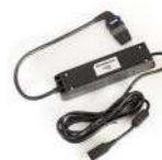
Cable USB de comunicaciones