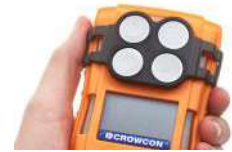
Placa de filtro externa Clip de filtro para entornos polvorientos