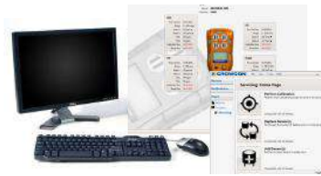
NOVEDAD Software Portables Pro 2.0 Para una configuración y servicio fáciles