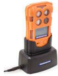
Base de carga Estación de toma de conexión para una fácil carga