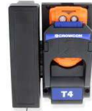
Cargador de vehículo Carga efectiva y almacenamiento mientras viaja