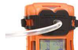
Placa de calibración/contraste Para aplicación de gas de pruebas para T4