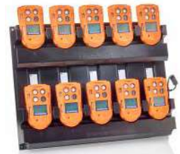
Cargador de 10 vías Para la carga y almacenamiento de su flota T4